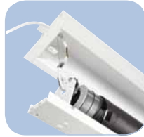
Mecanismo de fijación a través de la carcasa