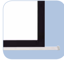
Barra inferior triangular que se oculta en la carcasa