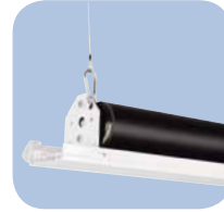
Componentes y Tela de Pantalla