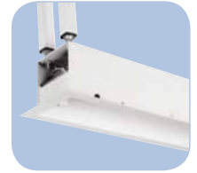
Carcasa de la pantalla