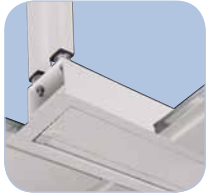
Perfecta integración en el techo